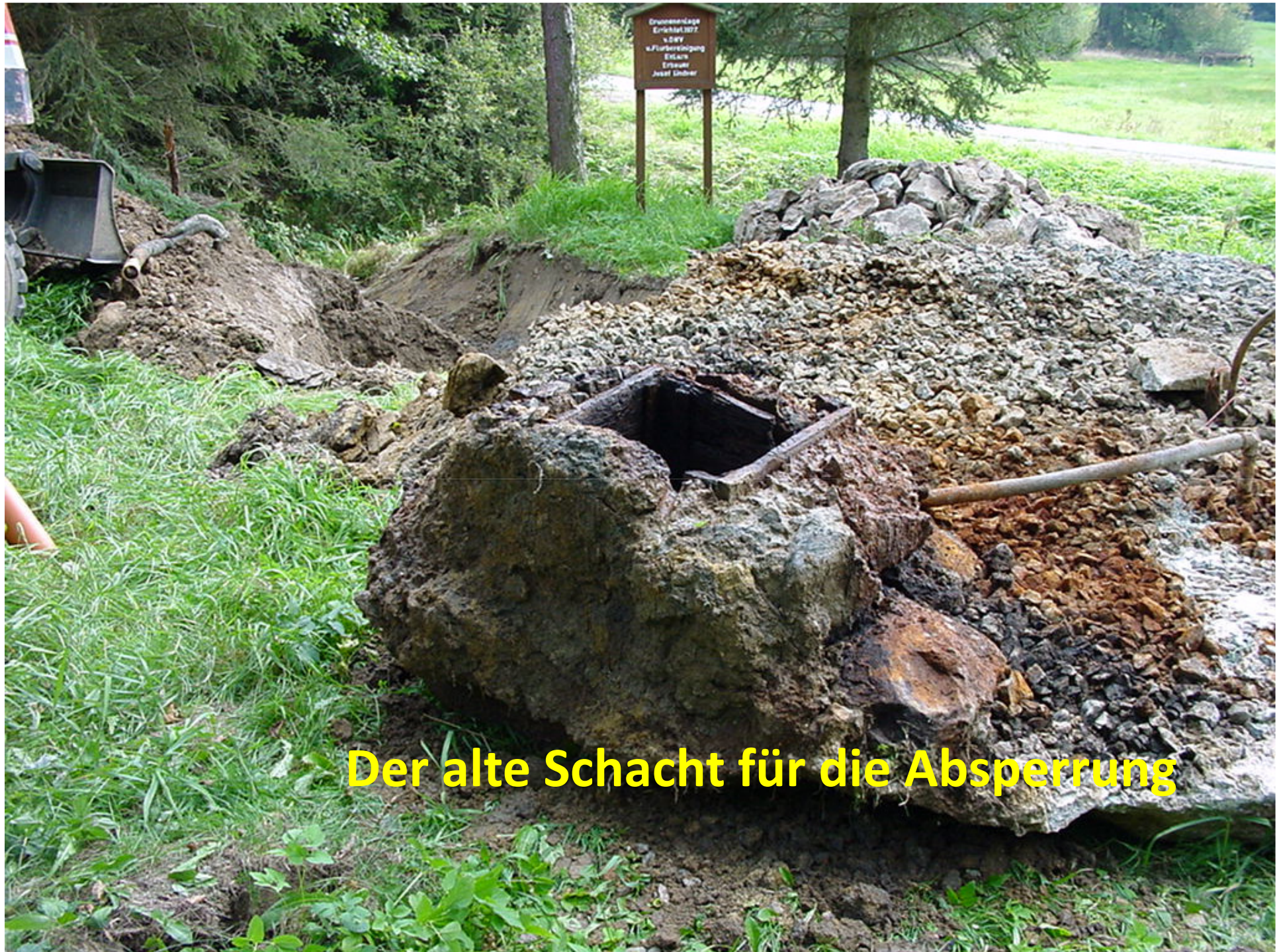
Der alte Schacht für die Absperrung